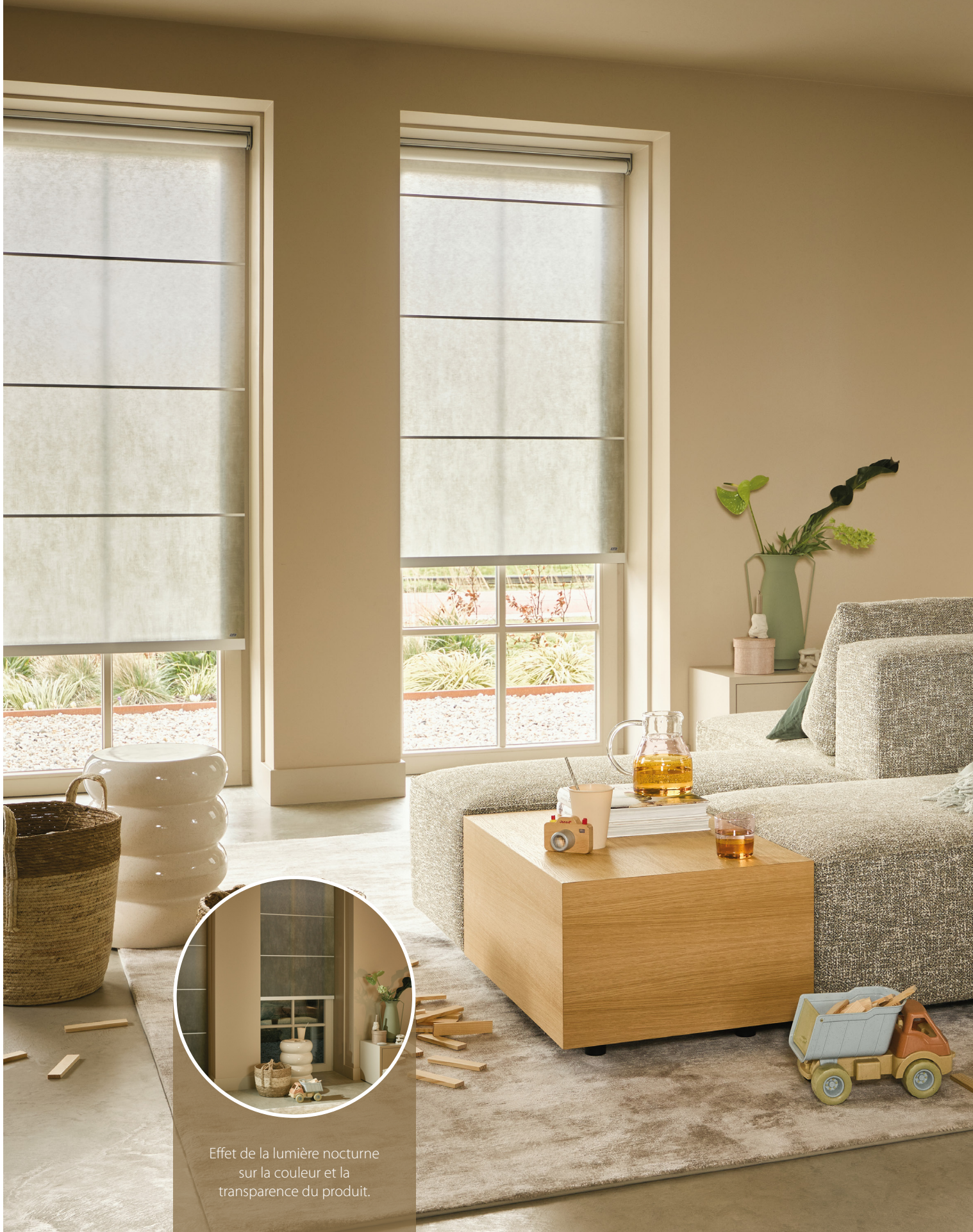
Effet de la lumière nocturne sur la couleur et la transparence du produit.